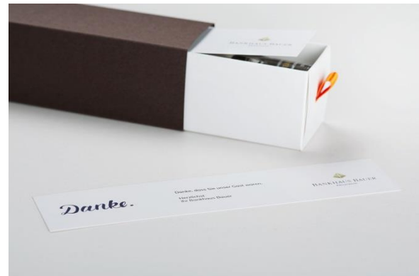
Jede Box enthält eine personalisierbare Danke-Grußkarte mit Wunschttext und ggf. Kundenlogo – schon ab Auflage 1.