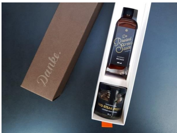
Die neue Dankebox „Rheinland Barbecue“.