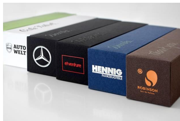
Die Dankebox als Werbeatikel: Individuelle Farben nach Corporate Design – von der Kartonage bis zur Logoprägung.

Download weiterer Pressebilder und druckfähiger Daten unter: www.dankebox.de/presse