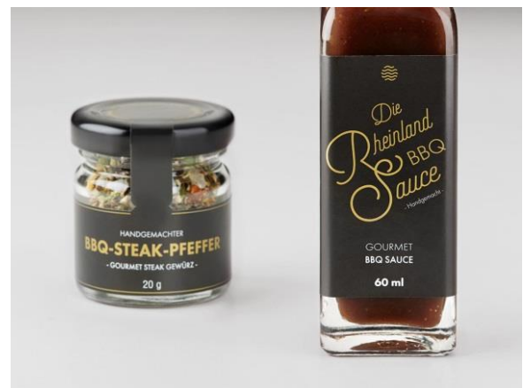
Rheinland BBQ-Sauce und BBQ-Steak-Pfeffer.