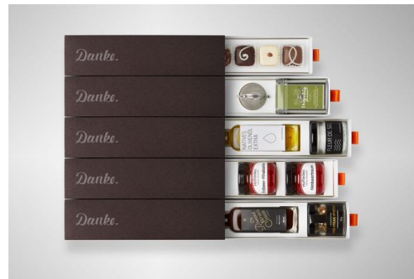
Aktuell sind fünf Produktvarianten erhältlich.