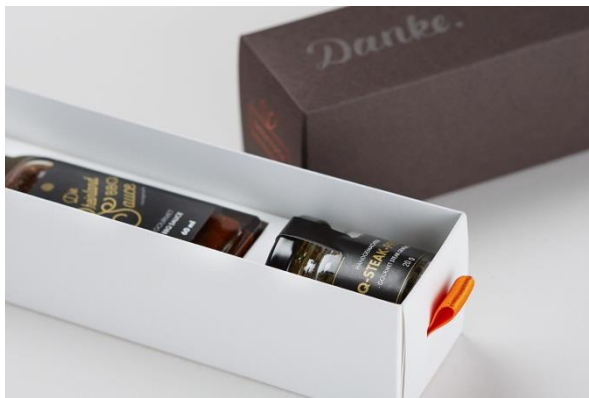
Ein edles und nachhaltiges Design-Geschenk.